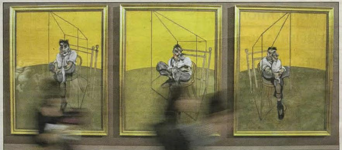
Ce triptyque signé Bacon, vendu en novembre dernier 105,9 millions d'euros aux enchères est à ce jour, l'œuvre d'art la plus chère au monde.

est un peintre de la condition humaine. Celle des autres et la sienne. Sur la toile, il a souvent exprimé ses douleurs, ses souffrances. À la force des couleurs et des traits saccadés. Voire torturés. L'héritage artistique de Francis Bacon aujourd'hui est visible dans les plus prestigieux musées et centres d'art contemporain du monde. Et à Monaco, la fondation tâchera de transmettre la force de son travail.