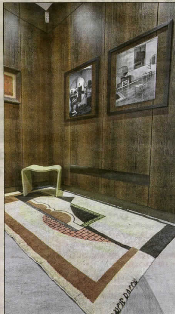
La fondation présente désormais un tapis et un tabouret réalisés par Bacon, dans sa période designer à l'aune des années 30.